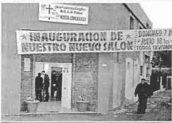
Inauguración del nuevo Salón el día 7 de Julio.

Confiamos en que el Señor está sosteniendo y cuidando a cada uno de ustedes. Nosotros estamos todos