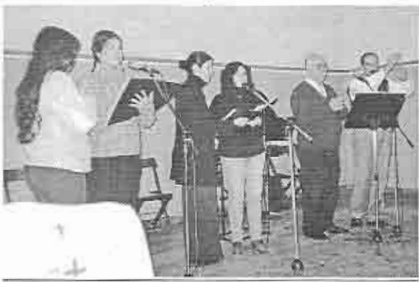
Grupo de alabanza

El primer fin de semana en Carolina del Norte visitamos a nuestros amigos en nuestra iglesia de Myrtle Grove en Wilmington (como 4 horas manejando). Aprovechamos para pasar una tarde en la playa. Fue muy lindo, y les hablamos mucho de ustedes, nuestros amados hermanos en la Argentina. Es hermoso ver cómo